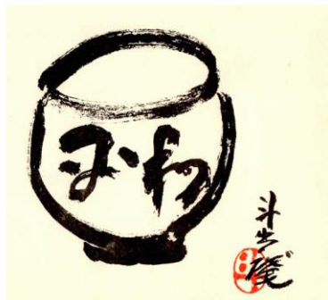
平和 茶碗の図 人間国宝 荒川豊蔵氏描 多治見西 RC 創立 10 周年記念誌より 右写真 虎溪山開山堂