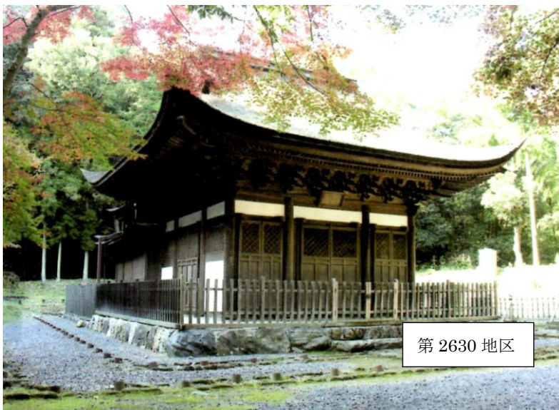
第 2630 地区