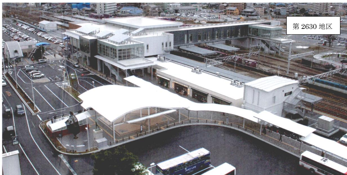
第 2630 地区