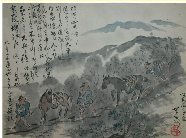
「険道運荷駄図」 文化勲章受章者 荒川豊蔵氏描