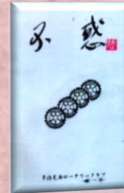
創立 40 周年記念誌