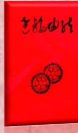
創立 20 周年記念誌