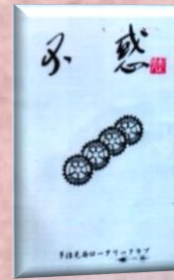
創立 40 周年記念誌