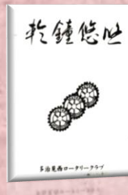
創立 30 周年記念誌