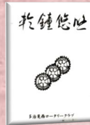
創立 30 周年記念誌