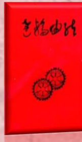
創立 20 周年記念誌