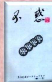
創立 40 周年記念誌