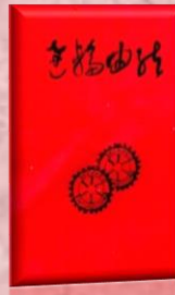
創立 20 周年記念誌