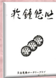
創立 30 周年記念誌