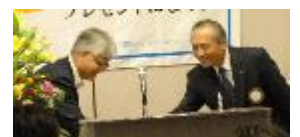
岡田ガバナーへお礼