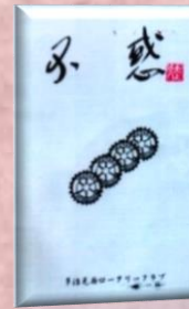
創立 40 周年記念誌

第 2387 例会 2015 年 8 月 27 日 50 周年記念式典まであと 238 日