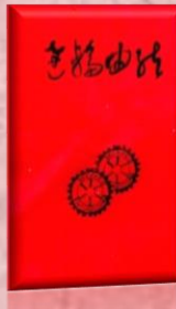
創立 20 周年記念誌