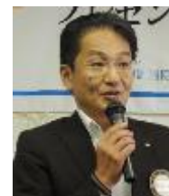
東濃信用金本店 本店営業部長