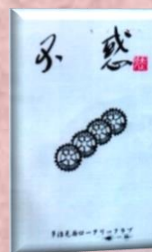
創立 40 周年記念誌