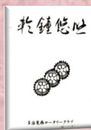
創立 30 周年記念誌