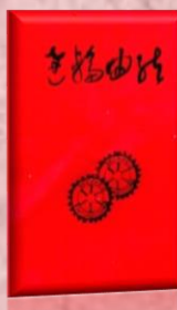
創立 20 周年記念誌