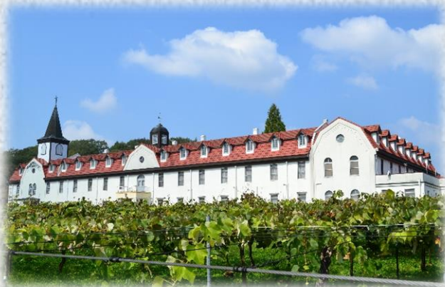
神言会多治見修道院