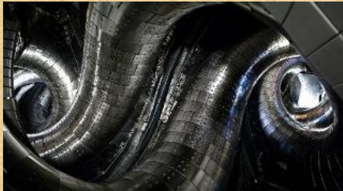
核融合発電を目指す大型ヘリカル装置 (岐阜県土岐市)