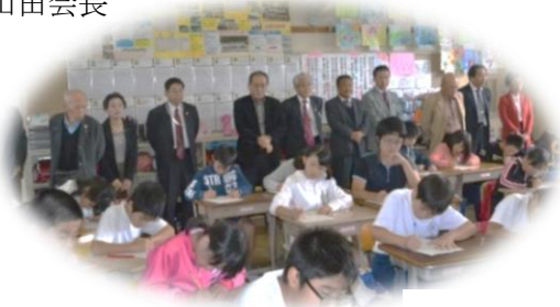
精華小学校6年生 の活動を見学